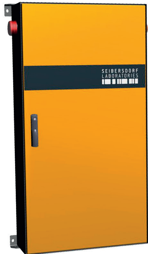
Abb.1: Portalmonitor Primas Compact zur Wand oder Deckenmontage

Die Detektorgehäuse sind derart konzipiert, dass eine maximale Empfindlichkeit in Richtung der durchfahrenden Fahrzeuge erreicht wird. Gleichzeitig wird über eine Bleiabschirmung sichergestellt, dass der Einfluss der natürlichen Umgebungsstrahlung weitgehend minimiert wird. Die Detektion der Strahlung erfolgt mit Gammadetektoren. Jeder Gammadetektor besteht aus einem Plastiksintillator mit einem Volumen von 13 Liter und angeschlossenem hochempfindlichen Photomultiplier mit nachgeschalteter Auswerteelektronik. In jeder Detektorsäule sind zwei Detektoren untergebracht, damit ergibt sich ein Detektionsvolumen von insgesamt 52 Liter. Für Anwendungen mit