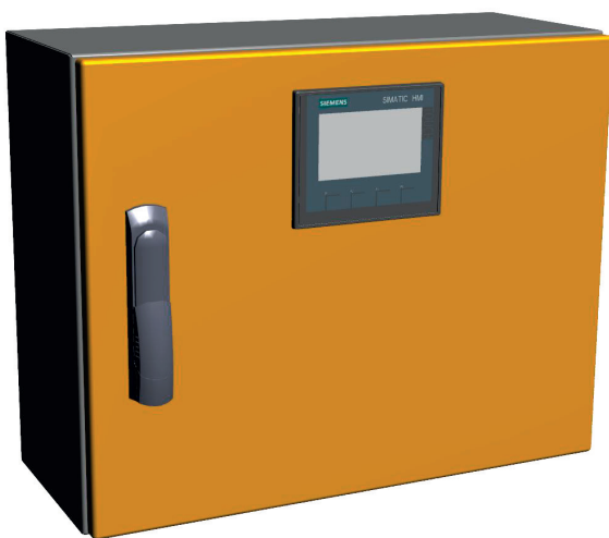
Abb.2: Auswerteeinheit zu Primas Compact

Lokalisierung der Strahlenquelle erfolgen kann. Zusätzlich wird die Geschwindigkeit der Fahrzeuge bzw. Waggons überprüft, bei zu hohen Geschwindigkeiten kann ebenfalls eine optische und akustische Warnung ausgegeben werden.