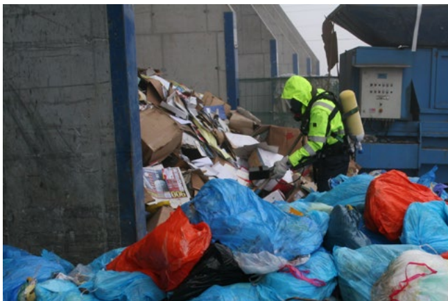
Abb.1: Aufspüren von Strahlenquellen bei Entsorgern und Wiederverwertern

Wir führen für Sie die vorgeschriebenen Dichtheitsprüfungen von Strahlenquellen durch (Alpha-, Beta und Gamma-Quellen, Prüfung gemäß ÖNORM S5222). Die Überprüfung erfolgt durch Wischtests, die in unserem Labor ausgewertet werden, oder auch durch Vor-Ort-Service, wenn das gewünscht bzw. vorgeschrieben ist. Das von uns ausgestellte Zertifikat wird von den Behörden als Nachweis der Quelledichtheit anerkannt (z. B. bei der §61-Überprüfung).