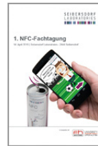
1. NFC Fachtagung 14. April 2016