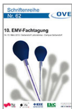
10. EMV Fachtagung 14. - 15. März 2012

OVE Schriftenreihe Nr. 75 ISBN: 978-3-85133-081-6 Preis EUR 25,--