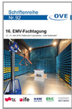
16. EMV Fachtagung 12. - 13. Juni 2018

Zusendung der Bestellung per e-mail an marketing@seibersdorf-laboratories.at oder per FAX an 050550-2502.