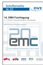
14. EMV Fachtagung 12. - 13. April 2016

OVE Schriftenreihe Nr. 92 ISBN: 978-3-903249-02-8 Preis EUR 32,--