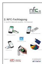
2. NFC Fachtagung 14. Juni 2018

OVE Schriftenreihe Nr. 62 ISBN: 978-3-85133-069-4 Preis EUR 25,--